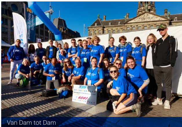
Van Dam tot Dam

In 2020 bestaat JDRF Nederland al tien jaar. Tien jaar waarin enorm veel gebeurd is, op het gebied van type 1 diabetes en onderzoek, voorlichting en de ontwikkeling van JDRF Nederland als organisatie.