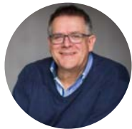
Dr. Henk-Jan Aanstoot Diabeter

Ook in Nederland levert JDRF een forse bijdrage aan wetenschappelijk onderzoek naar type 1 diabetes. Dit zijn de onderzoekers die in het boekjaar 2019-2020 een bijdrage ontvingen van JDRF.